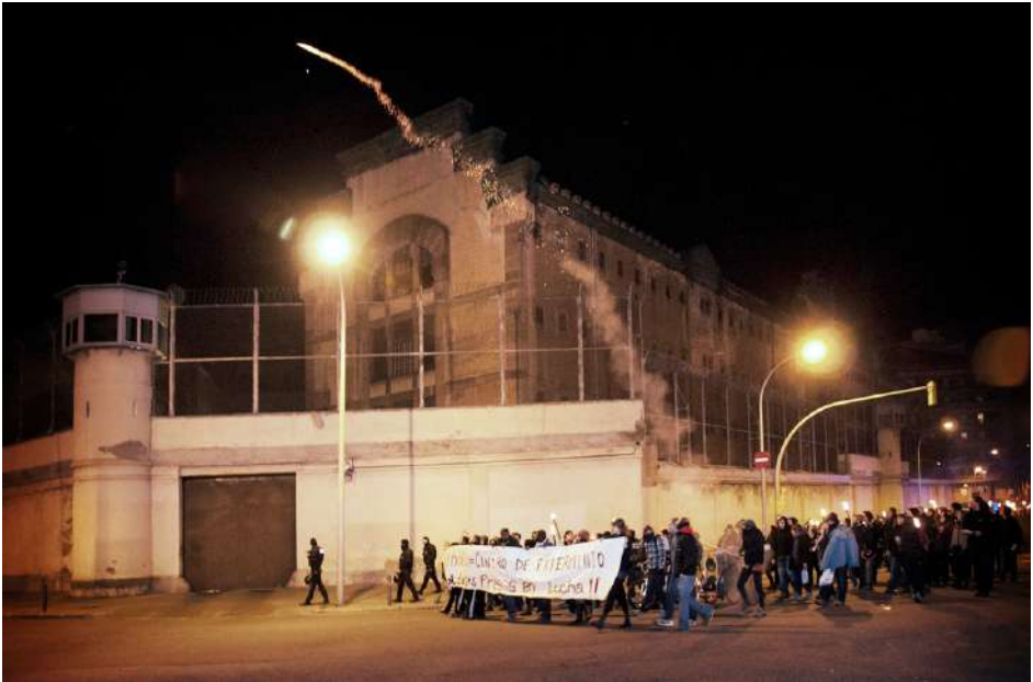
XVII Marxes contra les presons – Presó d'homes La Model (Barcelona), 31 de desembre de 2013