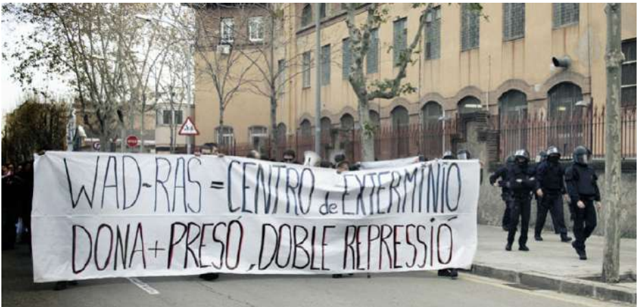
XVII Marxes contra les presons – Presó de dones Wad-Ras (Barcelona), 31 de desembre de 2013

És important preveure com es cobriran les necessitats econòmiques, materials i emocionals de la presa, si hi ha la intenció de dur a terme una campanya política que visibilitzi l'entrada a presó i molts altres aspectes. D'aquesta manera, en comptes de patir el tancament com quelcom traumàtic i desmobilitzador, obrim l'oportunitat d'utilitzar aquesta entrada a presó com una palanca perquè la gent es mobilitzi, ja sigui contra la maquinària que fa possible les Penes-Multa com en relació amb la lluita concreta que s'estava efectuant abans de l'empresonament.