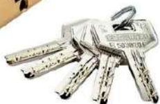
Model pany de pins