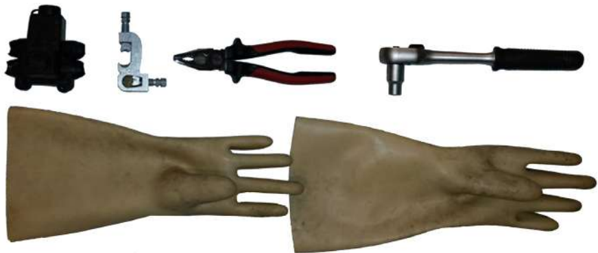
Eines per al Cas 2