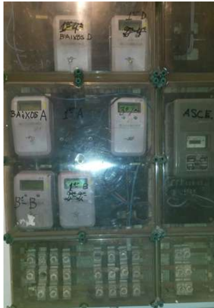
Quadre comptadors d'una comunitat de veïns. Comptadors a dalt i fusibles a baix.

Pas 1.: Observació de la situació, elements, i previsió de les tasques necessàries així com el dispositiu de seguretat. En aquest punt hem d'observar el nostre carrer, per on pot aparèixer la policia, veïns que puguin trucar-la, etc. Fet això hem de dissenyar un dispositiu capaç d'alertar-nos a temps per tal de "desaparèixer" abans no ens puguin veure.