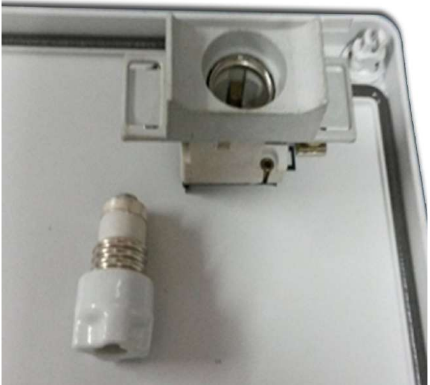
Exemple d'un fusible

Un cop tinguem tots els elements identificats hem de preveure les eines necessàries per a dur a terme la punxada. A nivell bàsic seran les que es detallen al final d'aquest punt.