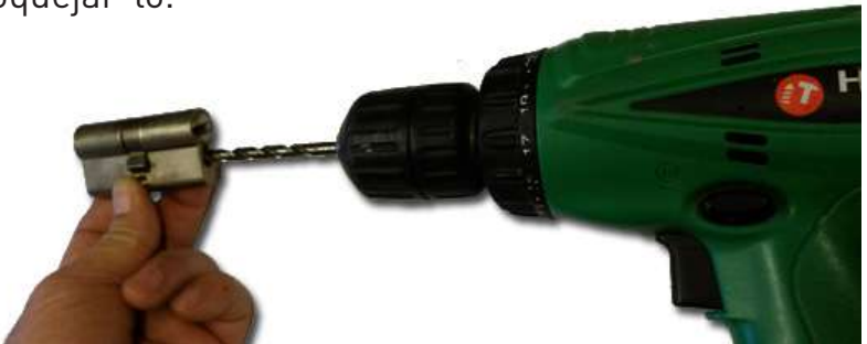
Exemple trepanació, es pot apreciar la palanca central que no hem de foradar

El primer que hem de fer és identificar la posició del pany, normalment els pins es troben a la part allargada a sota la ranura on inserim la clau. No obstant això també pot ser que el pany estigui muntat a l'inrevés i estiguin cap amunt. Sigui com sigui sempre són a la part més allargada sota el cilindre de la clau. Tenint clar això comencem a fer una trepanació allà on hi ha els pins (no on hi ha la ranura de la clau). Així hem de trepanar fins arribar a mig pany, ho notarem per un canvi de resistència, és important ser atents, doncs si trepanem massa podem deformar la palanca que obre el pany i bloquejar-lo.