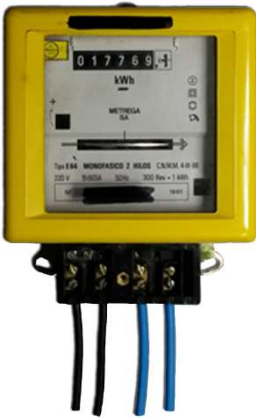
Model comptador clàssic. Fase d'entrada i sortida a l'esquerra i neutres a la dreta.