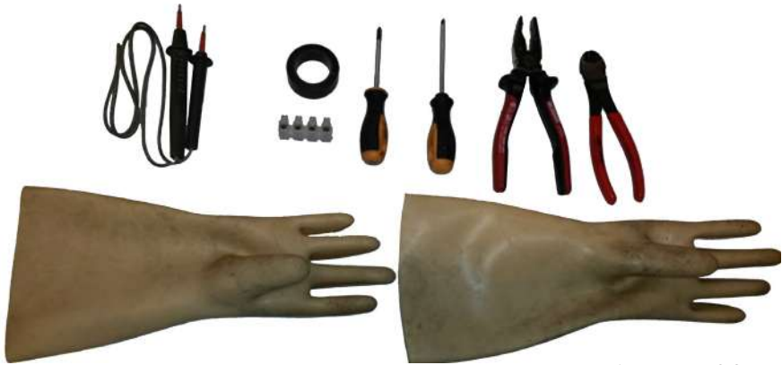
Eines per al Cas 1