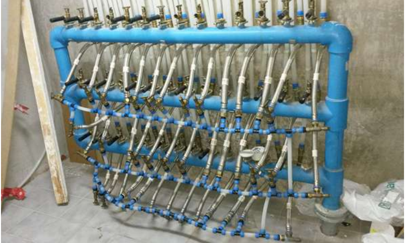
Exemple d'una punxada d'aigua a tot un veïnat

Fet això inserim el flexo mascle que a l'hora també connectem al tub que entra a casa. Llavors hem d'obrir al clau paulatinament per observar que el flexo treballa adequadament i no hi ha cap fuita.