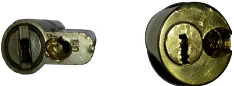
Exemples pansys trepanats