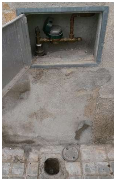
Exemple de comptador amb la clau de pas a terra

D'aquesta, surt l'escomesa que va fins al comptador que solem tenir o a la façana o dins de casa. El reconeixem fàcilment perquè sol estar en un calaix amb una porta metàl·lica. Un cop passa pel comptador ja entra a la nostra instal·lació.